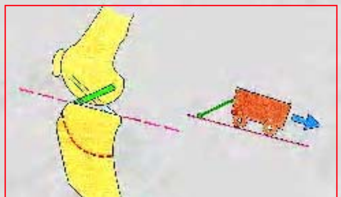
Abb. 2: Schematische Darstellung des Knies eines Hundes. Durch die geneigte Gelenkfläche des Unterschenkels ist das vordere Kreuzband (dunkelgrün) unter ständiger Belastung. Wie das Wagenmodell auf der schiefen Ebene will der Oberschenkel nach hinten „wegrollen“. Die Schnur – das vordere Kreuzband – ist gespannt.

Der Mensch kann – im Gegensatz zum Hund – ohne grosse Belastung des Bandapparates des Knies stehen. Hüft-, Knie- und Sprunggelenk befinden sich im Stand in der gewichtstragenden Achse parallel übereinander und die Unterschenkel-Gelenkfläche ist horizontal hierzu ausgerichtet. Beim Mensch tritt ein Riss des vorderen Kreuzbandes immer als Folge einer traumatischen Überbelastung auf, weshalb auch vom „Fussballerknie“ gesprochen wird.