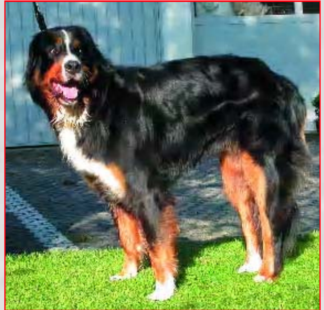
Abb. 5: Bernersennenhund mit beidseitigem Kreuzbandriss. Beachten Sie die Entlastung der Hinterhand durch Verlagerung des Körpergewichtes auf beide Vorderbeine.

Eine völlig neuartige Methode, welche in den USA bereits seit den 80er-Jahren angewendet wird und von dem Kleintierchirurgen Dr. Barclay Slocum erfunden wurde, ändert die Biomechanik des Kniegelenkes und erzielt vor allem bei schweren Hunden wesentlich bessere Resultate als die „alten“ Techniken. Die nach hinten geneigte Unterschenkel-Gelenkfläche (Abb. 2) – Ursache für die Entstehung des vorderen Kreuzbandrisses – wird bei dieser Technik horizontal gedreht bzw. korrigiert (Abb. 6 und 7). Dadurch