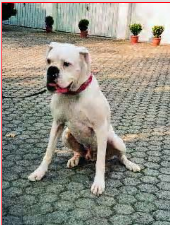
Abb. 3: Positiver Sitztest bei einem Boxer als Folge eines Anrisses des vorderen Kreuzbandes im linken Knie (siehe Text).

Wie bereits erwähnt, muss zwischen einem kompletten Riss und einem Anriss des vorderen Kreuzbandes unterschieden werden. Hunde mit einem kompletten Riss sind deutlich lahm und brauchen das betroffene Bein fast nicht mehr. Diese Verletzung kann z. B. beim Spielen, Katze hinterherrennen oder aber auch ohne grosse Belastung auftreten. Nach einigen Tagen bessert sich diese