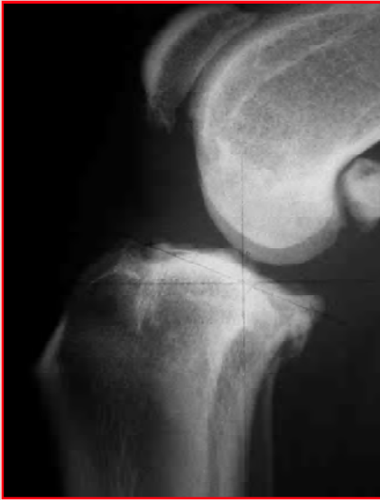
Abb. 4: Seitliches Röntgenbild eines Hundeknies mit einem seit 6 Monaten unbehandelten vorderen Kreuzbandriss. Bemerkenswert ist das massive Ausmass der Arthrose.

Hund nicht in der Lage ist, es schmerzfrei voll zu beugen. Zur Entlastung wird er deshalb das betroffene Knie nach aussen stellen.