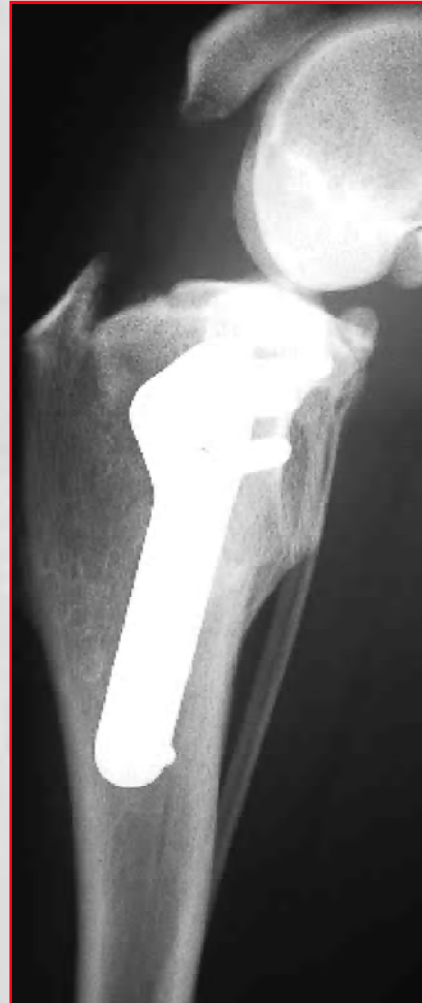
Abb. 8: Seitliches Rönt- genbild des gleichen Hundeknies 8 Wochen nach der Operation. Der Knochen ist geheilt.

wird diese so weit gedreht, bis die Funktion des vorderen Kreuzbandes nicht mehr benötigt wird. Das gedrehte Knochenfragment wird anschliessend mit einer Platte und Schrauben wieder stabilisiert (Abb. 6 und 7).