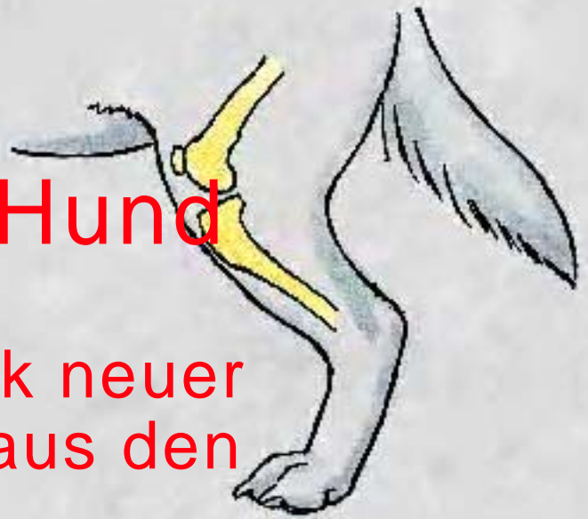
Abb. 1: Position der Knochen der Hinterhand eines Hundes im Stand.

Der Riss des vorderen Kreuzbandes im Knie zählt zu den häufigsten orthopädischen Verletzungen des Hundes und ist in vielen Fällen die Ursache für eine Hinterbeinlahmheit. Ein kompletter Riss des vorderen Kreuzbandes führt zu einer Instabilität im Knie, welche von Entzündung und Schmerz begleitet wird. Der Hund hinkt deutlich oder läuft nur noch auf drei Beinen. Sehr oft kommt es aber zu einem Anriss des vorderen Kreuzbandes. In diesen Fällen ist zwar die Stabilität des Knies erhalten, Entzündung und Schmerz führen aber auch zu einer mehr oder weniger starken Lahmheit. Sowohl ein kompletter wie ein partieller Riss des vorderen Kreuzbandes müssen operiert werden. Ohne chirurgische Behandlung wird die Lahmheit nicht verschwinden und Arthrose im Gelenk entstehen.