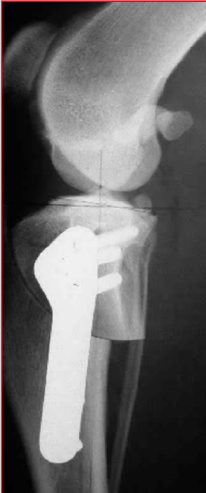
Abb. 7: Postoperatives seitliches Röntgenbild eines Hundeknies nach Schwenkung der Unterschenkel-